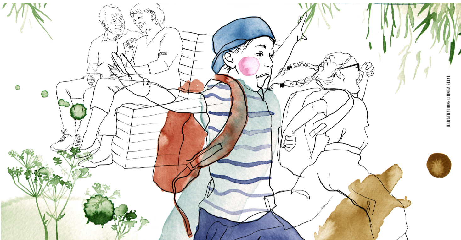
ILLUSTRATION: LINNEA BUXT.